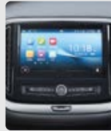
PANTALLA MULTIMEDIA 10"