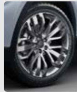
NEUMÁTICOS RIN 20