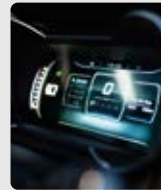
PANEL DIGITAL DE INSTRUMENTOS 12.3"