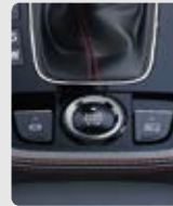
BOTÓN ENCENDÍO / AUTOHOLD / PARKING