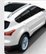
ASISTENTE EN PENDIENTE (HAC)